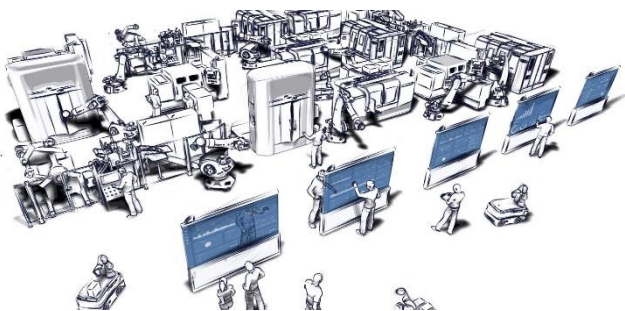
Bild 2: Im Exzellenzcluster »Internet of Production« arbeiten die Wissenschaftlerinnen und Wissenschaftler u.a. an cloudbasierten Steuerungssystemen für die Fertigung der Zukunft.